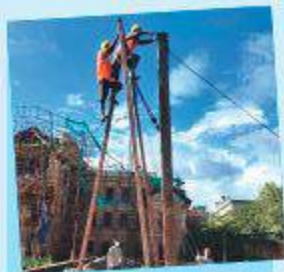
प्रतिबन्धन अवलोकन भवन-बनौडी