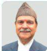
हरिहर शर्मा उपकुलपति