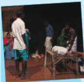
सिङ्गल प्रविधिमा नाटक