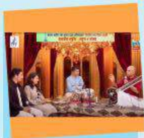
सङ्गीत र संवाद सुभारम्भ