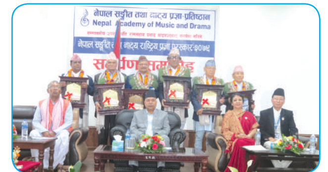
नेपाल सङ्गीत तथा नाट्य राष्ट्रिय प्रज्ञा पुरस्कार समारोह