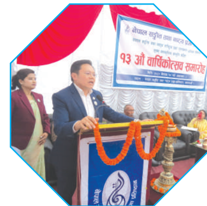
९३ औं वार्षिकोत्सव