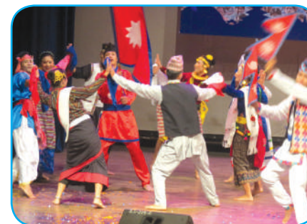
गणतान्त्रिक सांस्कृतिक साँझ